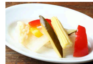
自家製ピクルス 550 Homemade Pickles