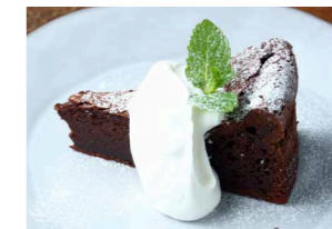
ガトーショコラ 500 Gateau au Chocolat