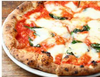
マルゲリータ 1,500 Margherita モッツアレラチーズ、グラナパダーノチーズ、バジル、トマトソース