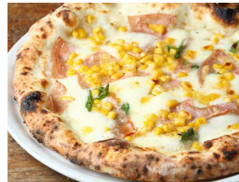
モルタデッラハムとコーンのバンビーノ 1,600 Bambino モッツアレラチーズ、グラナパダーノチーズ、スイートコーン、モルタデッラハム