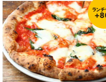
水牛モッツアレラチーズのマルゲリータ ランチセット +800 2,450 Margherita D.O.C 水牛モッツアレラチーズ、グラナパダーノチーズ、バジル、トマトソース