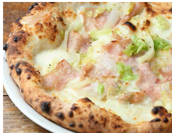
イタリアサラミと季節野菜のオルトラーナ 1,500 Ortolana イタリアサラミ、グラナパダーノチーズ、オレガノ、季節の野菜、玉ねぎ