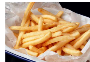
フライドポテト 650 French Fries