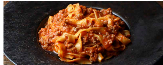
じっくり煮込んだポローニャ風ミートソース フェットチーネ 1,600 Fettuccine, Bologna-style Meat Sauce