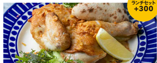
丸鶏チキンローストの半身を使ったインパデッラ ランチセット +300 1,700 Impadella ade with Half of a Whole Chicken Roast