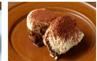
ティラミス 500 Tiramisu