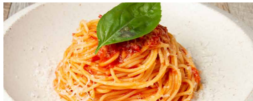
フレッシュトマトとバジリコのスパゲッティーニ 1,300 Spaghettini w/Fresh Tomatoes & Basil