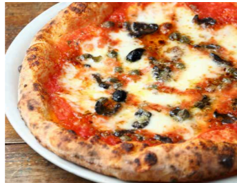
シチリアーナ 1,500 Siciliana グラナパダーノチーズ、モッツアレラチーズ、オレガノ、アンチョビ、ブラックオリーブ、ケッパー、トマトソース