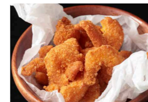
ポップコーンシュリンプ 750 Popcorn shrimp