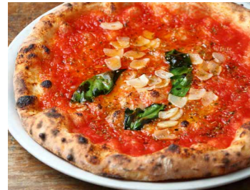
マリナーラ 1,300 Marinara グラナパダーノチーズ、オレガノ、バジル、ニンニク、トマトソース