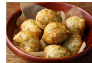
生海苔の入ったゼッポレ 500 Zeppoline (Fried Pizza Dough)