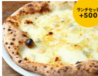
クワトロフォルマッジ ランチセット +500 1,900 Quattro Formaggi モッツアレラチーズ、ゴルゴンゾーラチーズ、グラナパダーノチーズ、タレッジョ