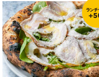
ポルケッタ エ ルッコラ ビアンカ ランチセット +500 1,900 Porchetta e Arugula Bianca モッツアレラ、グラナパダーノチーズ、プチトマト、ポルケッタ、ルッコラセルバチコ