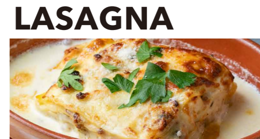
魚介のクリームソースラザニア 1,400 Cream Sauce Lasagna with Seafood